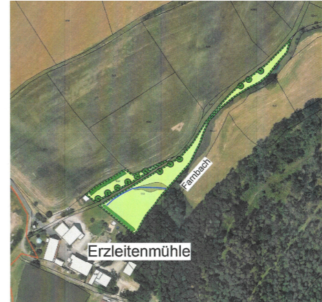
Legeplan Ausgleichsfläche (unmaßstäblich)