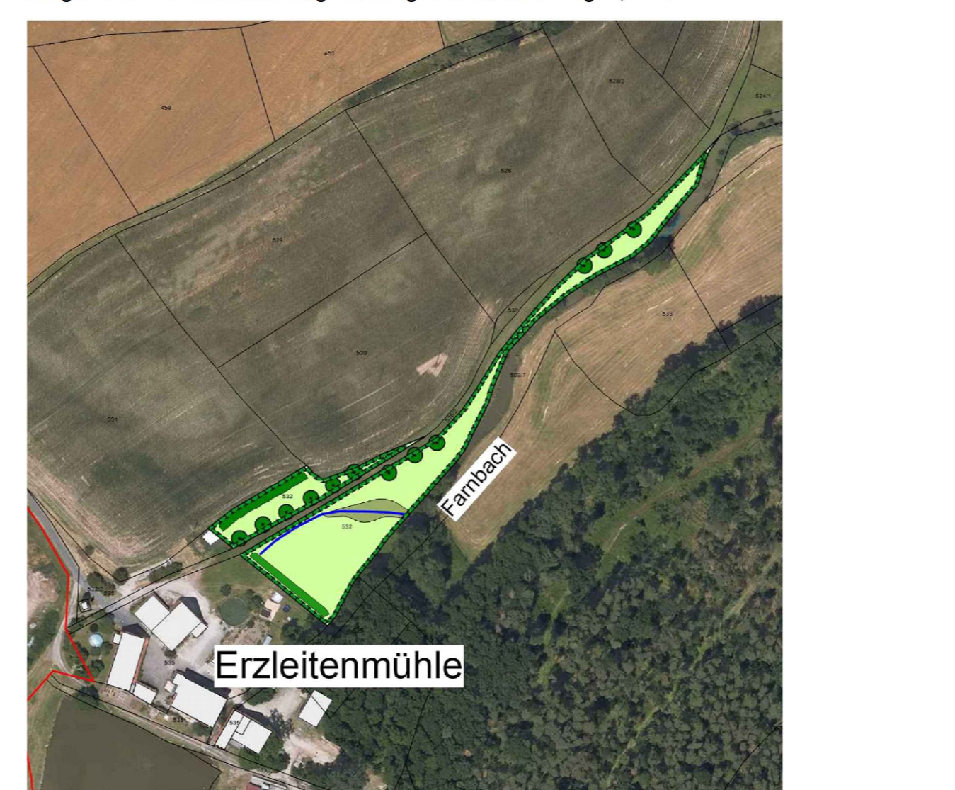
Lageplan Ausgleichsfläche (unmaßstäblich)

Zuordnungsfestsetzung nach § 9 (1a) BauGB Als Ausgleichsfläche wird das Flurstück 532 Gemeinde Seukendorf, Gemarkung Seukendorf festgesetzt. Der Gesamtumfang der Ausgleichsfläche beträgt 0,5 ha.